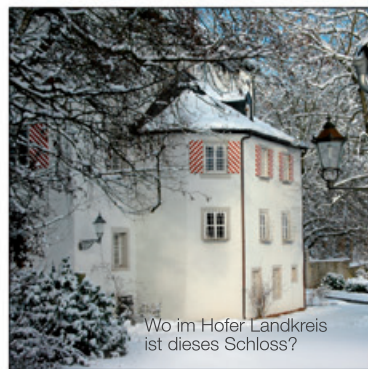
Wo im Hofer Landkreis ist dieses Schloss?