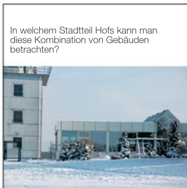
In welchem Stadtteil Hofs kann man diese Kombination von Gebäuden betrachten?