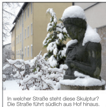
In welcher Straße steht diese Skulptur? Die Straße führt südlich aus Hof hinaus.

Wechselnde ....., Schatten und Licht, alles ist Gnade, drum fürchte dich nicht