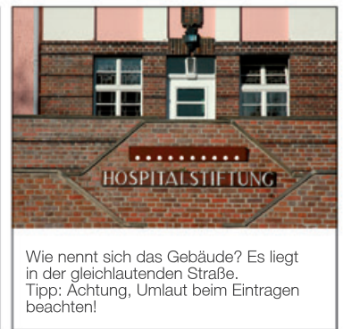
Wie nennt sich das Gebäude? Es liegt in der gleichlautenden Straße. Tipp: Achtung, Umlaut beim Eintragen beachten!