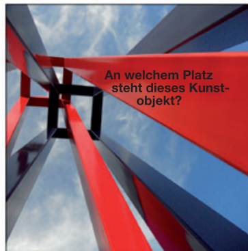
An welchem Platz steht dieses Kunstobjekt?