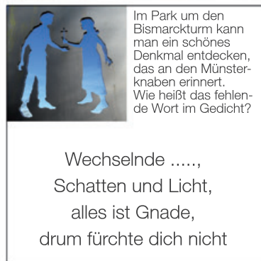
Im Park um den Bismarckturm kann man ein schönes Denkmal entdecken, das an den Münsterknaben erinnert. Wie heißt das fehlende Wort im Gedicht?

Wechselnde ....., Schatten und Licht, alles ist Gnade, drum fürchte dich nicht