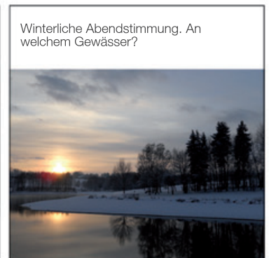
Winterliche Abendstimmung. An welchem Gewässer?