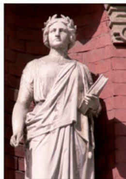
In welcher Straße der Innenstadt kann man diese Statue bewundern?