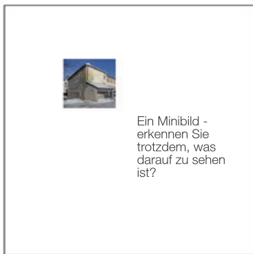
Ein Minibild - erkennen Sie trotzdem, was darauf zu sehen ist?