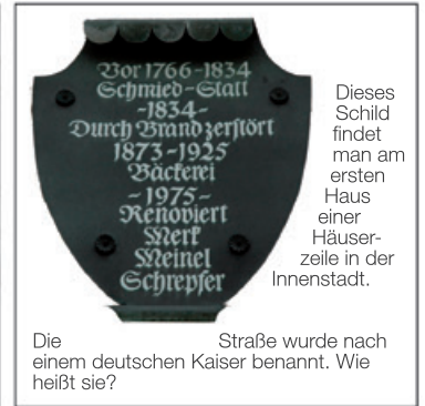
Dieses Schild findet man am ersten Haus einer Häuserzeile in der Innenstadt.