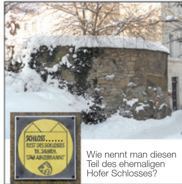
Wie nennt man diesen Teil des ehemaligen Hofer Schlosses?

In diesem Monat suchen wir ein oft genutztes Gerät. Was das ist, erfahren Rätselfreunde, wenn sie die richtige Antwort finden. Zu gewinnen gibt es dreimal je ein Hof-Monopoly im Gesamtwert von rund 120 Euro. Schicken Sie die Lösung an: PRO HOF, Konrad-Adenauer-Platz 1, 95028 Hof. Der Einsendeschluss ist der 20. Januar 2011.